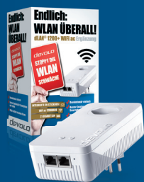
dLAN® 1200+ WiFi ac: 09388 (CH)