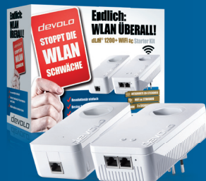
dLAN® 1200+ WiFi ac Starter Kit: 09395 (CH)