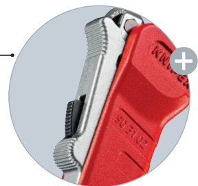
Za pomocą mechanizmu szybkiej regulacji jedną ręką sprężysty krążek tnący może być dosuwany do średnicy rury