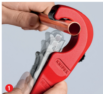
1 Łatwe cięcie: przyłóż obcinak do rur KNIPEX TubiX® ...