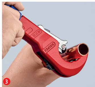
3 Przetnij rurę obracając narzędzie, a następnie wyreguluj za pomocą ergonomicznego niebieskiego pokrętki ...