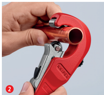
2 Krążek tnący z mechanizmem szybkiej regulacji QuickLock dosuń do rury: szybkie dopasowanie do rur o różnych średnicach ...