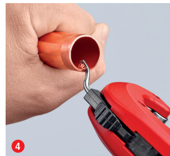
4 Gotowe! W razie potrzeby możliwe jest wygładzenie powstałej w wyniku przecięcia krawędzi za pomocą rozkładanego gratownika i to przy zaskakująco niewielkim wysiłku.