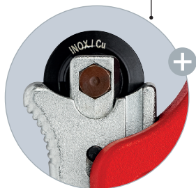
Łatwa wymiana sprężystego krążka tnącego z łożyskiem igielkowym wykonanego z wysokiej jakości stali na łożyska