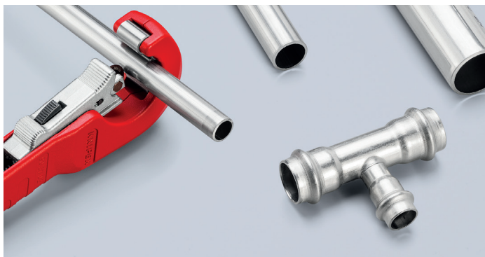
Jeszcze szybsza praca: dzięki szybkiej regulacji jedną ręką QuickLock wystarczy jedno naciśnięcie kciukiem, aby krążek tnący przesunął się dopasowując do dowolnej średnicy rury.

← Długość całkowita nie zmienia się podczas pracy →