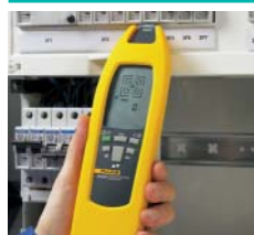
Posizione di fusibili e interruttori e assegnazione ai circuiti