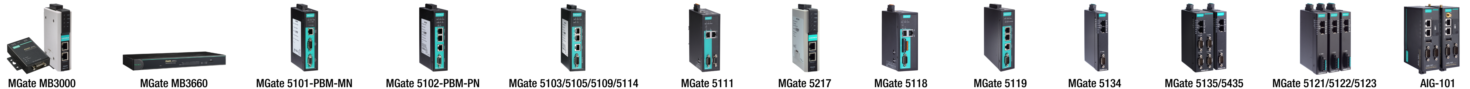
MGate MB3000 MGate MB3660 MGate 5101-PBM-MN MGate 5102-PBM-PN MGate 5103/5105/5109/5114 MGate 5111 MGate 5217 MGate 5118 MGate 5119 MGate 5134 MGate 5135/5435 MGate 5121/5122/5123 AIG-101