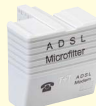
40 03 30