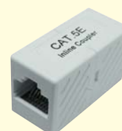
Modular-Verbinder Kat.5e ungeschirmt