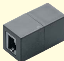
Modular-Verbinder ISDN geschirmt