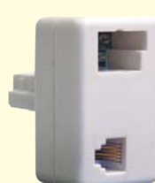
40 33 21