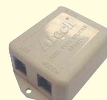
40 33 20