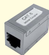
Modular-Verbinder Kat.6 geschirmt