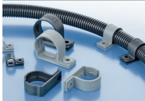
Tube clamp one-piece