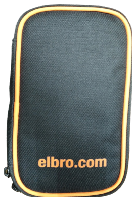
Etui CA17 E-No 980 910 049