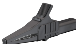
Pince crocodile XKK1001/1