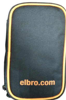
Etui CA17 E-No 980 910 049