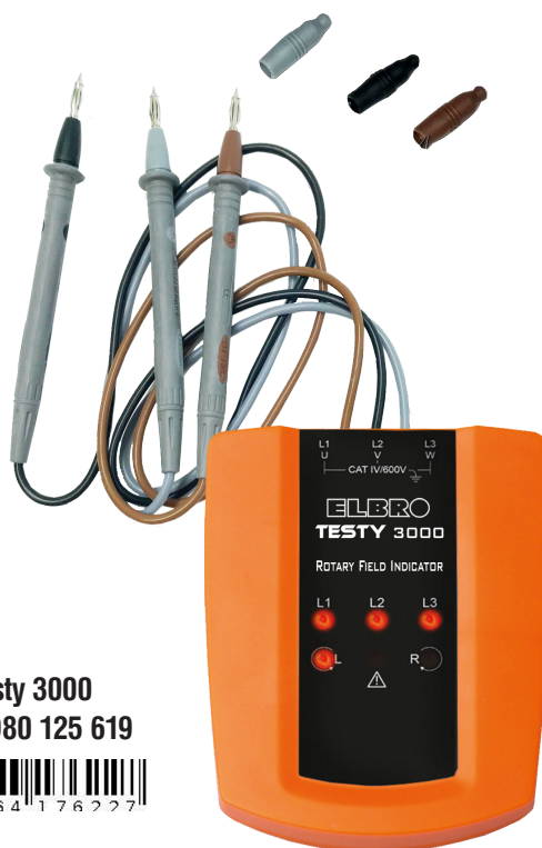
Testy 3000 E-No 980 125 619