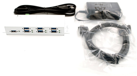
EX-K1110 - DC-Jack ~ Terminal Block