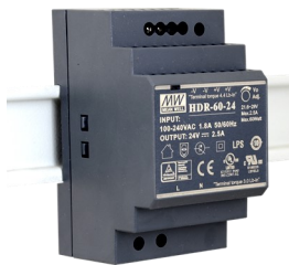
EX-6973 - Netzteil / Power Supply