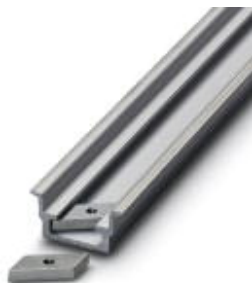
Gleitmutter, für Tragschiene NS 35/15-AL, mit M4-Gewinde, zur Befestigung von Geräten, Material: Stahl

Bitte beachten Sie, dass die hier angegebenen Daten dem Online-Katalog entnommen sind. Die vollständigen Informationen und Daten entnehmen Sie bitte der Anwenderdokumentation. Es gelten die Allgemeinen Nutzungsbedingungen für Internet-Downloads. ( http://phoenixcontact.ch/download )