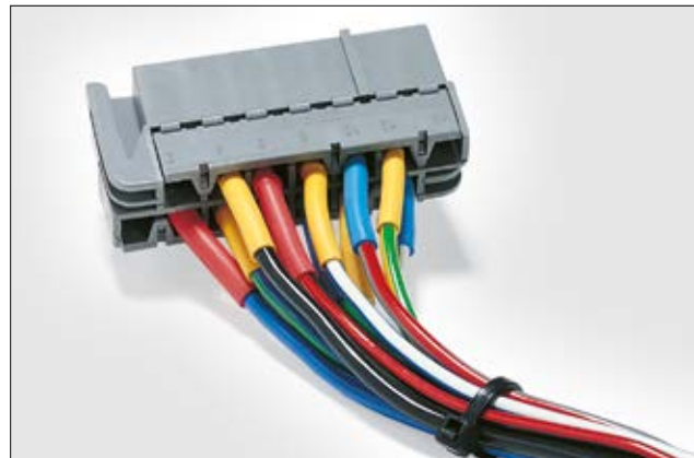
HFT-A er VG-godkjent for militært utstyr.