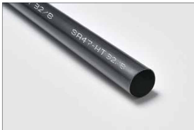
Guaina termorestringente SA47-HT per applicazioni fino a 150 °C.

Spezzoni disponibili su richiesta. Contattaci!