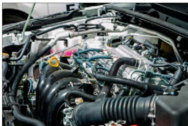
SA47-HT fornisce una elevata protezione dalle infiltrazioni in applicazioni ad elevata temperatura.