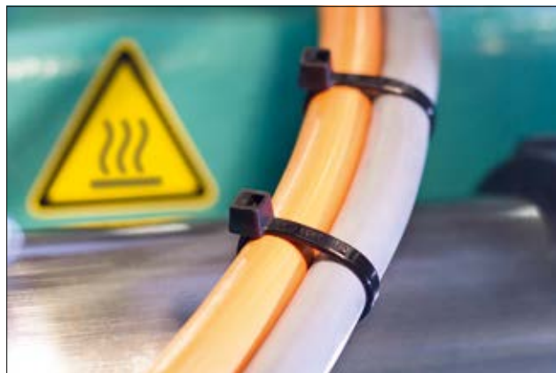
Varmestabiliserte bånd i T-serien, for temperaturer opp til +105 °C.