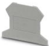
Abschlussdeckel, Länge: 42,5 mm, Breite: 1,5 mm, Höhe: 30,7 mm, Farbe: grau