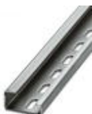
G-Profil-Tragschiene, Material: Stahl, gelocht, Höhe 15 mm, Breite 32 mm, Länge 2 m

Tragschiene - NS 32 PERF 2000MM - 1201002