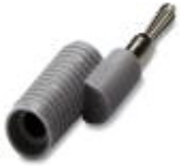
Reduzierstecker, Farbe: grau