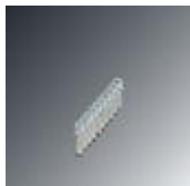
Feste Brücke, Polzahl: 10, Farbe: silberfarben