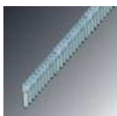
Feste Brücke, Polzahl: 40, Farbe: silberfarben