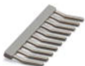
Einlegebrücke, Polzahl: 10, Farbe: grau