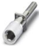
Prüfsteckerbuchse, Farbe: silberfarben

Prüfsteckerbuchse - PSBJ 3/13/4 - 0201304