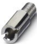
Prüfsteckerbuchse, Farbe: silberfarben

Prüfsteckerbuchse - PSB 3/10/4 - 0601292