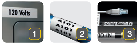
Plane overflader Buede overflader Kabler