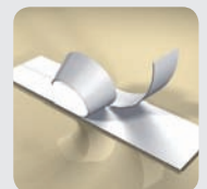
Slip-let todelt bagside

Ledninger, kabler, buede og kraftigt strukturerede overflader