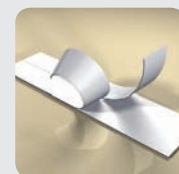
Splittet underlag som er enkelt å fjerne

I innlegg og andre bruksområder der de ikke behøver å limes på