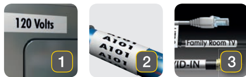
Flate overflater Buede overflater Kabel