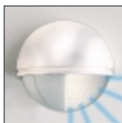
Reduzierung des Erfassungswinkels